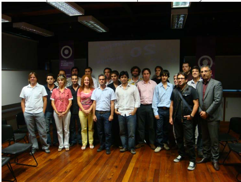
Delegación local de desarrolladores de videojuegos en la reunión informativa previa a la Game Developers Conference y Game Connection

Reunión informativa previa a la Game Developers Conference y Game Connection